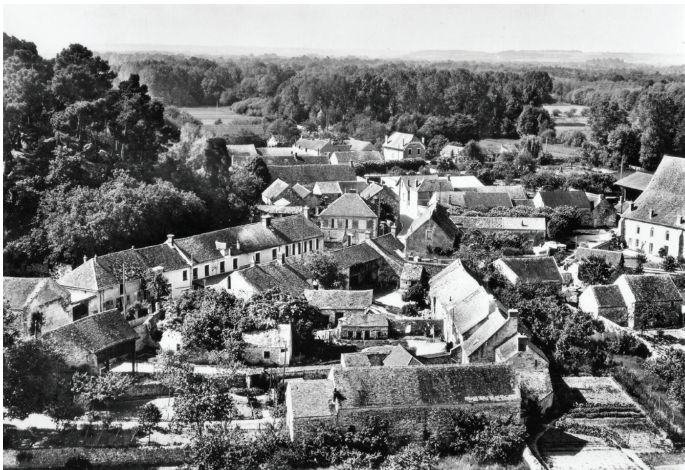
► Vue générale de Noisy-sur-Ecole (Seine-et-Marne). Carte postale des années 1950. Collection Musée du Plâtre.

est d'épargner de l'argent pour retourner au pays finir leurs jours au milieu des leurs. De plus, les sédentaires s'établissent plutôt dans la capitale 11 . Néanmoins, on sait que dès le milieu du XVII e siècle le Gâtinais est parcouru par des équipes de travailleurs migrants, et que ces derniers sont plus nombreux à partir de 1730, s'installant parfois définitivement 12 .