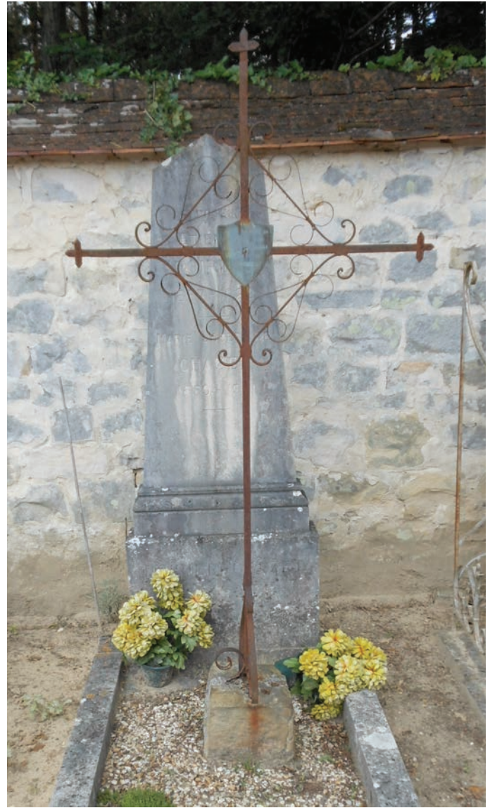
► Sépulture de Jean Pierre Chazet, 1886, cimetière de Noisy-sur-Ecole. Photo J. Hantraye, 2015.

Lorsque Pierre Chazet décède le 30 janvier 1882 42 , il se trouve avec sa femme 43 à la tête d'une nombreuse descendance, établie presque toute à Noisy. Son épouse et lui-même ont organisé leur succession. Plusieurs de leurs descendants exercent la profession paternelle. Dans ce contexte, le monument funéraire érigé au cimetière pose différentes questions. La présence d'une croix en métal n'étonne guère en ce lieu et en ce temps. On en trouve d'autres dans le cimetière de Noisy et dans ceux des environs, avant la généralisation des stèles ou des dalles en pierre quelques décennies plus tard. Dans la commune proche de Fromont, l'une de ces croix est faite d'essieux de tombereau, celles à motifs religieux étant toutefois les plus répandues 44 . Plus étonnante est l'ornementation du monument