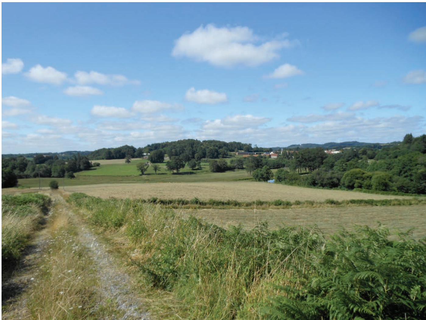
► Village d'Azat-Chatenet et paysage creusois. Photo J. Hantraye, 2012.